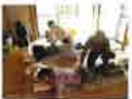
被災地陸前高田の仮設住宅で月1回の定例無料整体施術会