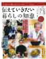
伝えていきたい暮らしの知恵(学研)