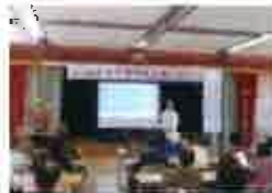
日出町役場の健康講演会