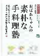
おばあちゃんの素朴な手料理塾 (エイ出版)