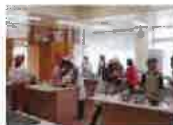
日出町社会福祉協議会での薬草教室