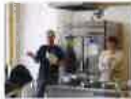
鷹見町のお料理会 (東京築地)