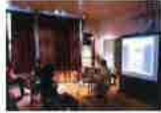
西栗倉村での村づくりの講演会