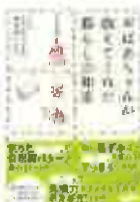
おばあちゃんから教えてくれた暮らしの知恵(たいね文庫)