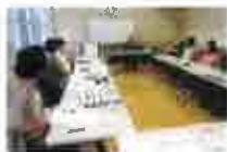
蓮生公園公民館ワークショップ