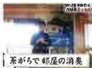
茶がらで 部屋の消臭