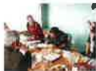
シアトルまで行って北米先住民のマカ族と「おばあちゃんの知恵」の交流(ヒマダね〜)