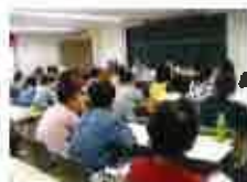
発達障がい児就労講演会（東京世田谷）