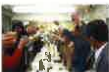
毎月10日は糖の日。糖尿病気療養会後のイベント