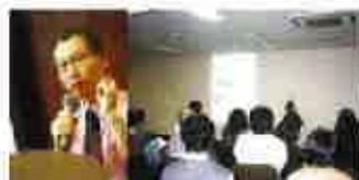
カタログハウス講演会