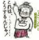
これはこうするんじゃ (白泉社)