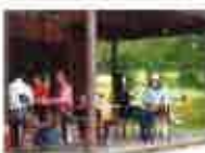
別荘で7年間開いた月1回の週末プチお食事会