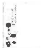
おばあちゃんからの暮らしの知恵(高橋書店)