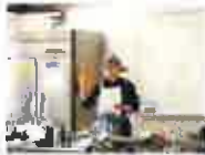
おばあちゃんの知恵料理 (東京築地)