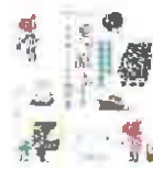
夏を涼しく!おばあちゃんの知恵袋(大和出版)