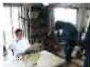
NHK報道番組ゆうどきネットワーク 「教えて！おばあちゃん」コーナー監修