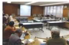
地域おこし協力隊との情報交換