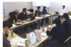
移住者との情報交換

空き家をお持ちの方や空き家になってしまいそうなうちをお持ちの方のご相談活動はもちろん、県外で空き家の問題に取り組んでいる事例の研修、県内の空き家視察やインスペクション(設計士による診断)、セミナーや相談会の開催等、様々な活動を積極的にを行っています。