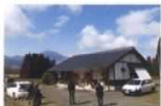
空き家現地視察会