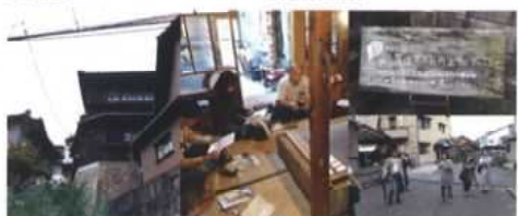
2016年9月 広島県 NPO尾道空き家再生プロジェクト 訪問&視察