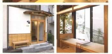
2019年4月 リノベーション設計「ワーキングa side-清舟屋」(旧市庁舎)