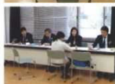
セミナー&空き家相談会(竹田市)