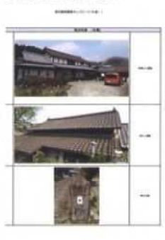
インスペクション(建築士によるチェック)