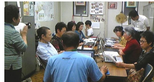
パソコン地域講座風景